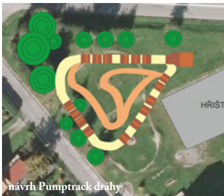
návrh Pumptrack dráhy