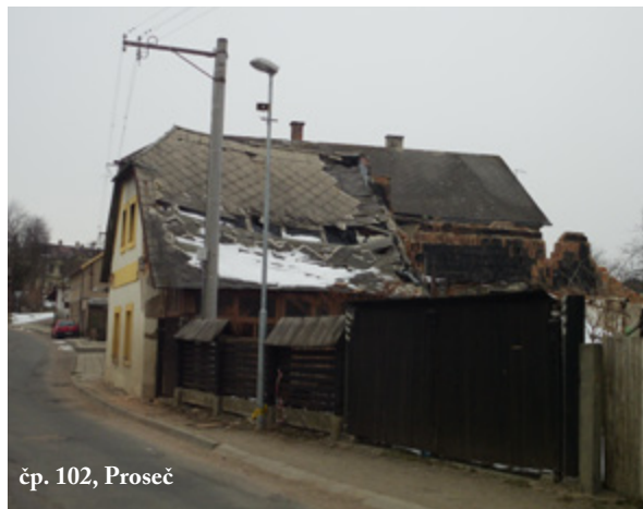
čp. 102, Proseč

tosti poblíž centra, které jsou nejen ostudou, ale i možným ohrožením pro naše občany. Dobrou zprávou pro všechny je, že se nám jednu nemovitost čp. 102 v Zabořské ulici podařilo po téměř dvouletém jednání odkoupit za účelem její úplné demolice. Nyní čekáme na vydání demoličního výměru a poté začnou práce, které povedou ke kompletnímu odstranění této stavby. Zahájení předpokládáme v průběhu srpna a celá nemovitost by mohla být do konce září zcela odstraněna. Odstranění této stavby kromě zvýšení bezpečnosti a zlepšení vzhledu této ulice umožní také rozšíření připravovaného chodníku v Zabořské ulici. Druhá nemovitost blíže k náměstí je dlouhodobě také oprávněným cílem kritiky ze strany