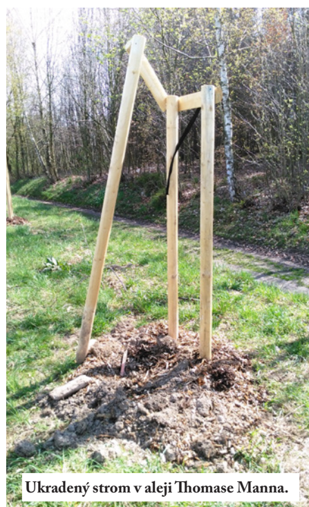
Ukradený strom v aleji Thomase Manna.